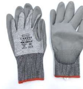
FOTO VARIANTE COLORE GUANTO PHOTO OF GLOVE COLOUR VARIANT